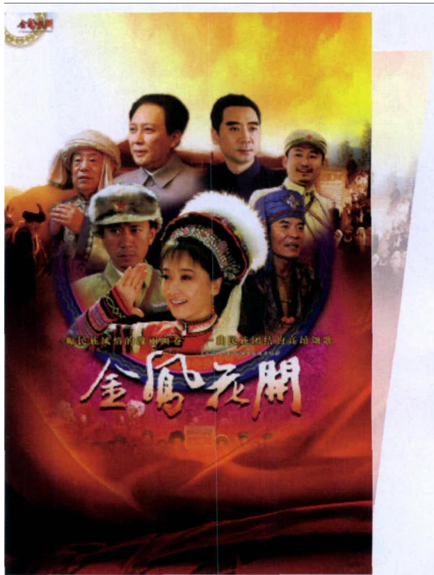
▲ 电视剧《金凤花开》剧照

新世纪以来，少数民族题材电视剧的创作内容和表现方式更加丰富，在类型呈现上也突破了惯常的家族戏和“红色剧”的窠臼，巧妙地将涉案、谍战、武侠、家庭伦理甚至宫斗等元素融入创作当中，呈现出多元发展的趋势。在《冰山上的来客》里，围绕着甄别真假古兰丹姆、间谍头目“真神”等展开叙事，充满悬念感和紧张度，颇有谍战、悬疑剧之风。《木府风云》更是混搭兼容了悬疑、武侠、伦理、宫斗等诸多元素。边疆叛匪与木府军队的较量，不乏武