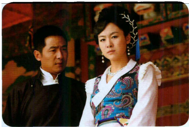
▲ 电视剧《西藏秘密》剧照

少数民族题材电视剧，依笔者见，是指以少数民族的文化底色、民族性格、价值观念、生存方式、审美取向为逻辑起点，在内容上反映少数民族地区的族群历史、生存状态、人物命运和情感诉求；在视听语言上体现少数民族文化内涵和审美价值的作品。